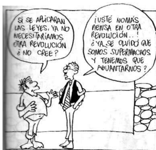
Figura 3. Mis Supermachos (Rius, 1990)

Cabe recordar que el cómic despliega formas lingüísticas complejas que combinan imágenes con texto escrito (aunque también pueden prescindir del texto, o transformarlo a su vez en imágenes). 8 La hermenéutica de la crítica al sistema jurídico mexicano que Rius plantea en el referido pasaje de Los Supermachos requiere entonces considerar las imágenes de Prieto y Estornino, a quienes el artista retrata en su particular estilo minimalista, consistente en una sencilla línea de grosor uniforme que prescinde de las sombras y deja una gran parte de la página en blanco (Rubenstein, 1998: 154). La reducción al mínimo de los recursos gráficos arroja una cruda luz sobre el estado de excepción en que los habitantes de San Garabato —y el resto de los mexicanos— se han resignado a vivir. El mensaje es tan claro que dificulta significativamente cualquier ejercicio retórico que pudiese justificar una actitud complaciente hacia la corrupción del régimen. Aunque Prieto y Estornino son “supermachos” que no tienen más remedio que “aguantar” que los funcionarios utilicen los recursos públicos para su provecho personal (Rius, 1990: 97), el lector es invitado a reflexionar sobre el estado de excepcionalidad perenne que, tanto en San Garabato como en México, han hecho del Derecho vigente un mero espectro cuya precaria existencia los funcionarios públicos pueden interrumpir a su antojo (Agamben, 2003).