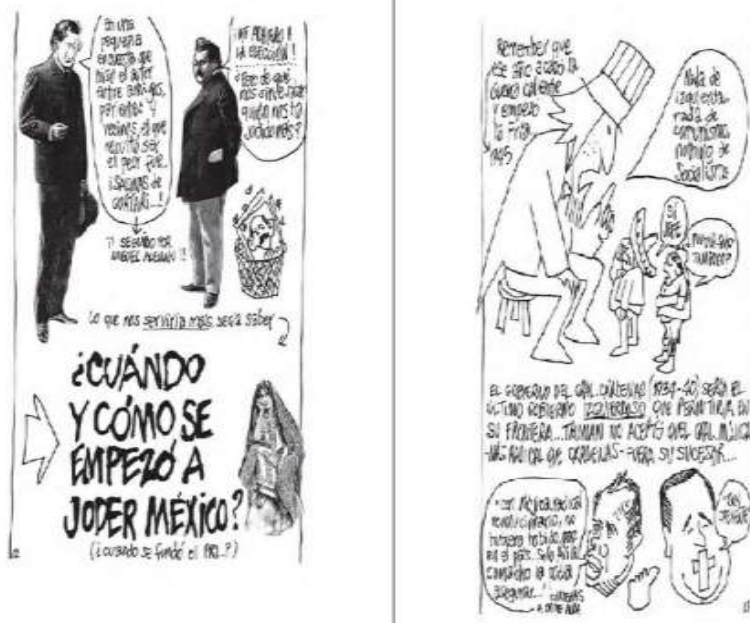
Figura 1. ¿Cuándo se empezó a xoder México? (Rius, 2015: 12-13)

El medio distintivo en el que trabajó Rius es el cómic o historieta —términos que utilizaré indistintamente a lo largo de este ensayo—, mismo que se caracteriza por desarrollar sinergias entre texto escrito e imágenes encapsuladas en secuencias yuxtapuestas de paneles y páginas (Kunzle, 1973: 2; McCloud, 1994: 9; Eisner, 2008: xi-xii). En este sentido, el cómic puede considerarse en sí mismo un lenguaje que expresa ideas ya mediante imágenes, ya mediante una combinación de texto escrito e imágenes, ya mediante la alteración visual del texto escrito (Eisner, 2008: 10-21, 2-5; Giddens, 2012: 93).