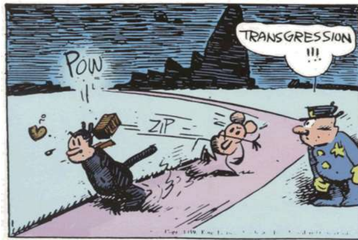
Figura 2. Krazy Kat (Herriman, 1939)

En cuanto elementos integrales de nuestras sensibilidades jurídicas, por tanto, los cómics (y demás productos de la cultura popular) definen nuestras concepciones de justicia y nuestra comprensión y práctica de las normas jurídicas. Uno de los más notables representantes del realismo jurídico norteamericano, Karl N. Llewellyn, así lo reconoció cuando, al reseñar una antología de viñetas de Krazy Kat —historieta producida por George Herriman entre 1913 y 1944—, en el lejano año de 1947, sugirió desde el Columbia Law Review a todos los “hombres de leyes” que leyeran dicho cómic “no una sola vez para divertirse, sino muchas veces para estudiar [el Derecho]” (338). La tira de Herriman se centra en las aventuras y desventuras de Krazy, un gato de género indefinido que ama locamente al ratón Ignatz. El amor en cualquier caso no es recíproco: Ignatz agrede continuamente al protagonista lanzándole ladrillos a la cabeza, gesto que el felino interpreta como muestras de amor. Por su parte, Krazy es constantemente protegido por el perro Offisa Pup, quien trata de evitar los ataques y encarcelar a Ignatz a modo de castigo.