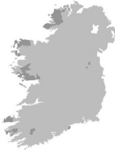
Figura 2. Localización de las gaeltacht en Irlanda

El siguiente mapa muestra la localización de las gaeltacht en Irlanda en las zonas más oscurecidas 19 .