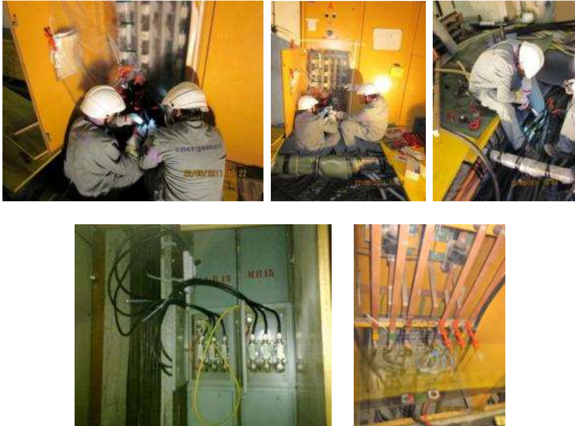
Slika 3. Zbirka fotografija RPN na NN – novo vezivanje vertikalnih NN vodova snage u UKCLJ [15]

Izvođači su bili svjesni velike odgovornosti tih prespajana, jer su usponski vodovi napajali iznimno osjetljive potrošače. Rad je uspješno završen bez ometanja procesa liječenja u UKCLJ, a nije utjecao i na sigurnost te zdravlje izvođača, električara.