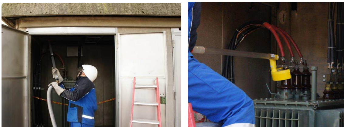
Slika 4. Čišćenje TP Očesna klinika – metoda RPN na SN na udaljenosti

Slijedi analiza Tehničke službe vezano za učinke RPN na SN i nakon poslovne analize potražiti varijantnu ponudu od EL za dosadašnji način održavanja, bez napona i novu metodu, RPN na SN.